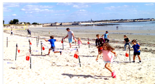
Du plaisir pour tous les publics

Cette formation peut nécessiter un accompagnant pour les personnes en situation de handicap. Tarif sur devis – Délai d'accès de 6 mois en moyenne – Document mis à jour 2022