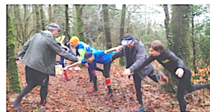
Aspects ludiques et découvertes diverses

Nous prenons le temps de découvrir les logiciels gratuits Mapper et Purple pour finaliser les documents pour votre public.