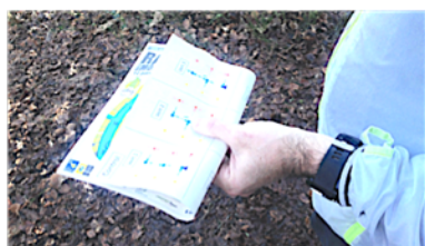
Le travail des techniques de base d'orientation