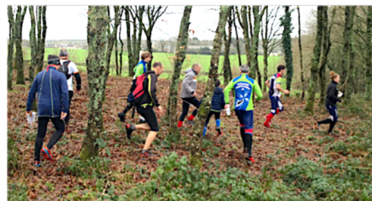
Dans des milieux agréables