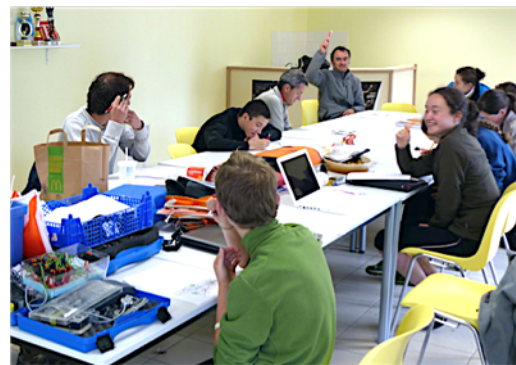
La mise en place des parcours : une organisation en équipe.