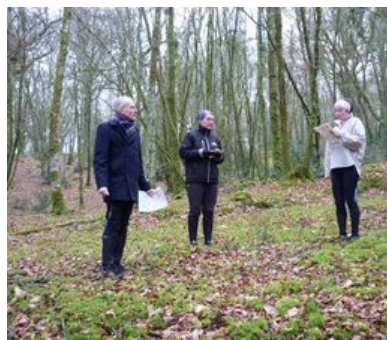
Une formation concrète, nourrie par les échanges