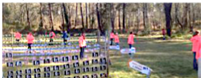
Parmi les missions : garantir le bon fonctionnement des départs.